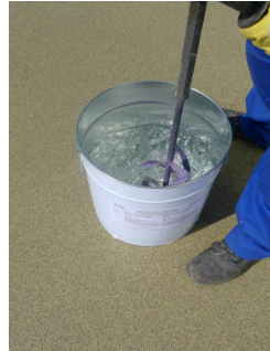
Bild 4 Harz und Härter mittels elektr. Rührquirl homogen verrühren.