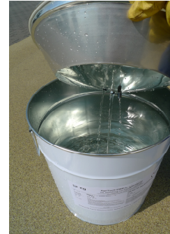
Bild 3 Härter in Blechimer durchlaufen lassen