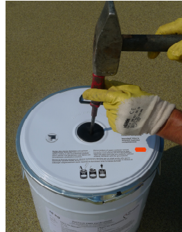
Bild 2 Deckeleinsatz mit Härterkomponente durchstoßen.