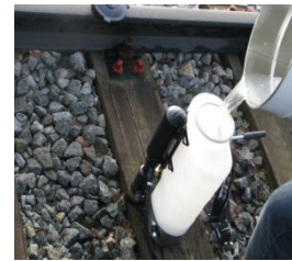
Bild 7 Auftragen mittels Gießkanne Bild 6