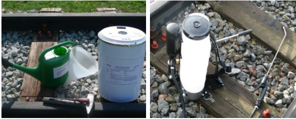
Bild 1 Zubehör

TS 02®-Handmaterial wird in einer fertig konfektionierten Zweikomponenten Verpackung zur Verfügung gestellt. Für eine ordnungsgemäße Verarbeitung sind folgende Dinge erforderlich: