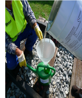
Bild 5 und Bild 6 Harz-Härtergemisch umtopfen